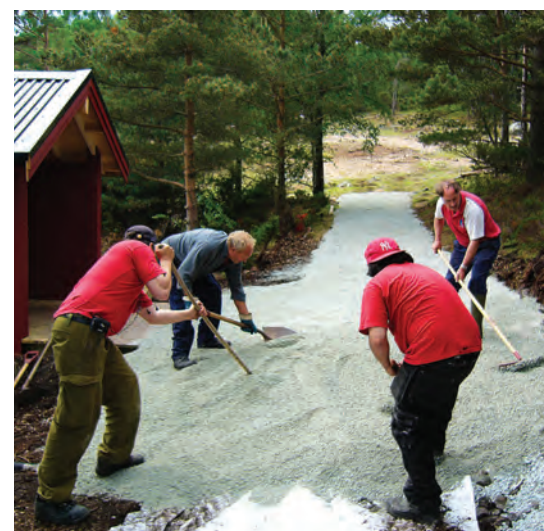
Tekst: Einar Haukaas

Både Ånensen og Sandvoll er enige om en hyggelig ting. I alle årene de har holdt på, har de aldri opplevd at det er gjort hærverk på brygger eller stasjoner. Måtte denne enestående statistikken fortsette!