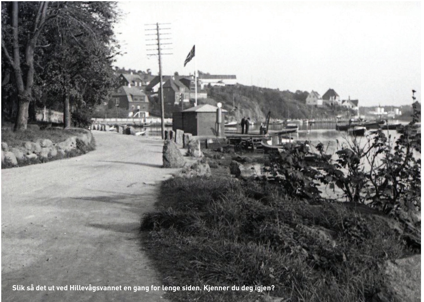
Slik så det ut ved Hillevågsvannet en gang for lenge siden. Kjenner du deg igjen?